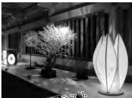
かみ灯りコンテスト